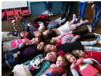
Groep 2 doet een gok.