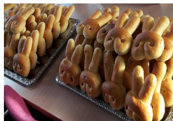
Paasbroodjes verzorgd door OC